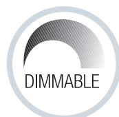
Table Lamp Lampada da tavolo Lampe de table Tischlampe Lámpara de mesa

For indoor use only Per uso interno Utiliser à l'intérieur Für innen Para interiores